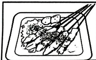
PELBAGAI JENIS MAKANAN TEMPATAN