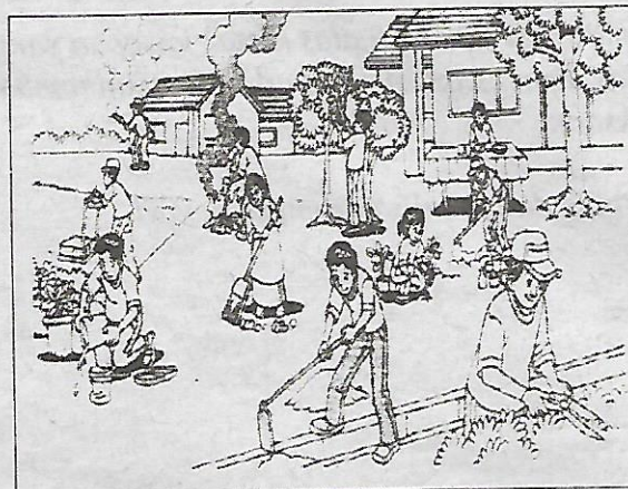
Memupuk perpaduan kaum