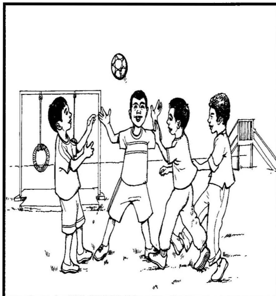
Sentiasa berada dalam kumpulan