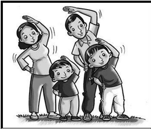
Memupuk Kasih Sayang